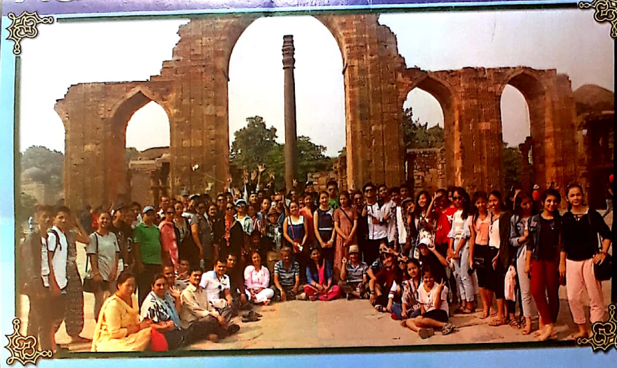
Class 10 students and teachers at Qutub Minar Delhi, India