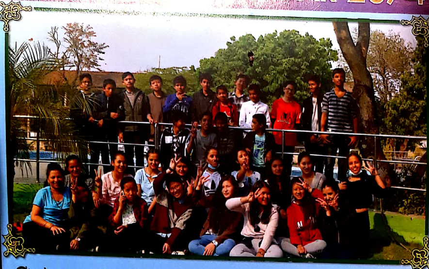
Students on their field trip at Sauraha, Chitwan