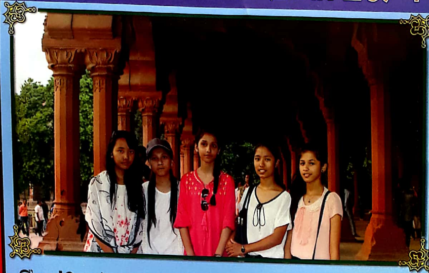
Class 10 students visiting Red Fort, Delhi, India