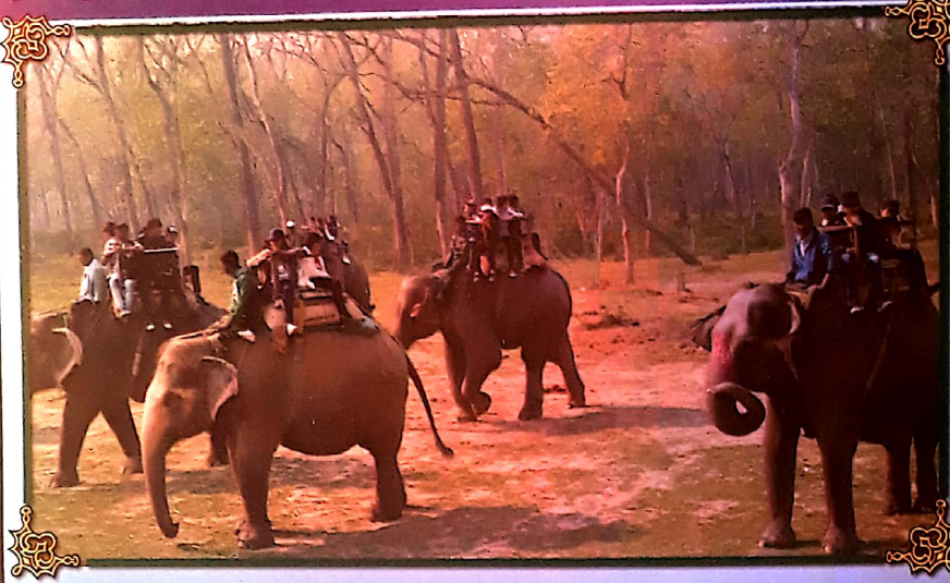
Jungle Safari by students of Class 8 at Sauraha, Chitwan