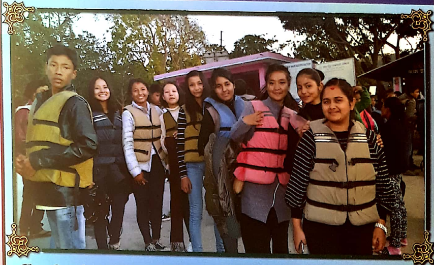
Class 9 students getting ready for Boating at Phewa Lake, Pokhara