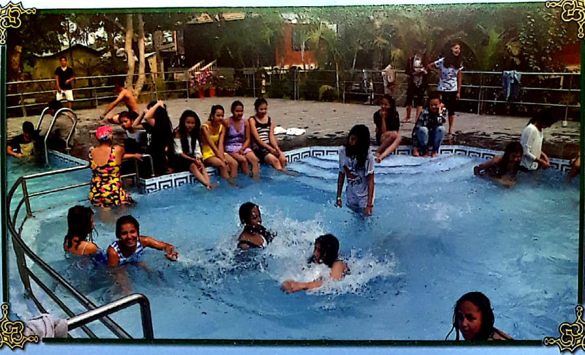
Class 8 Students enjoying swimming at Sauraha, Chitwan