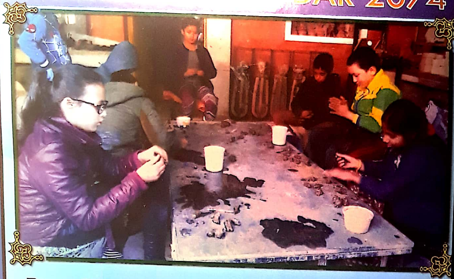
Primary Students at pottery class in the ECA camp